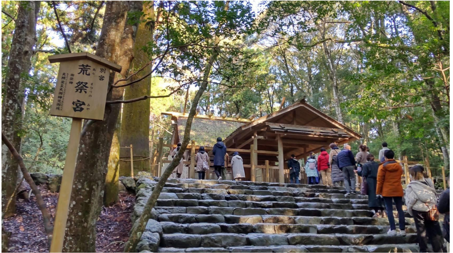
荒祭宮 (あらまつりのみや)