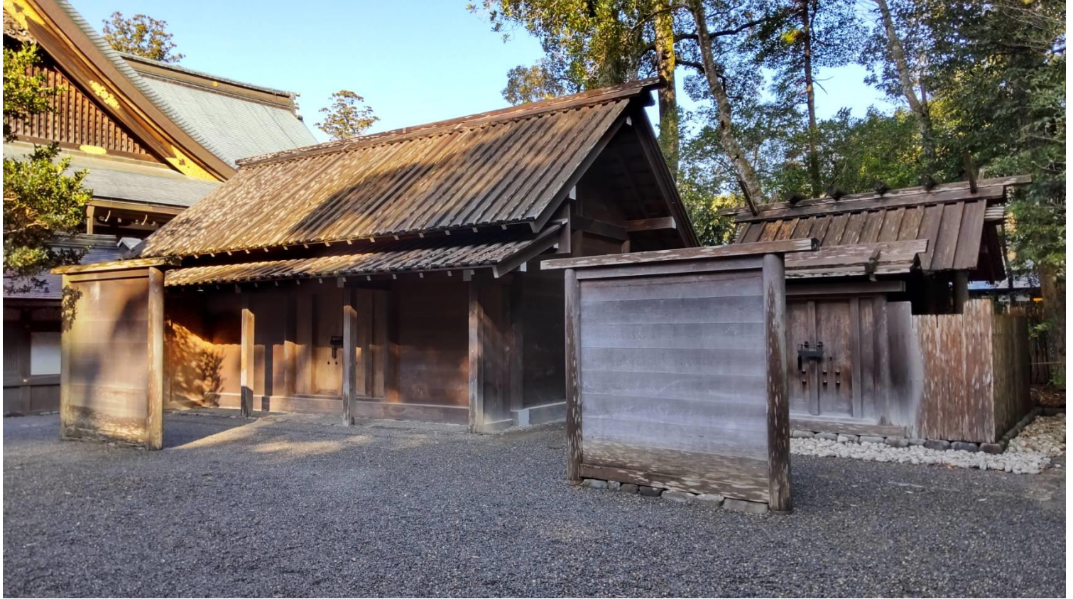
御 酒 殿 (みさかどの)