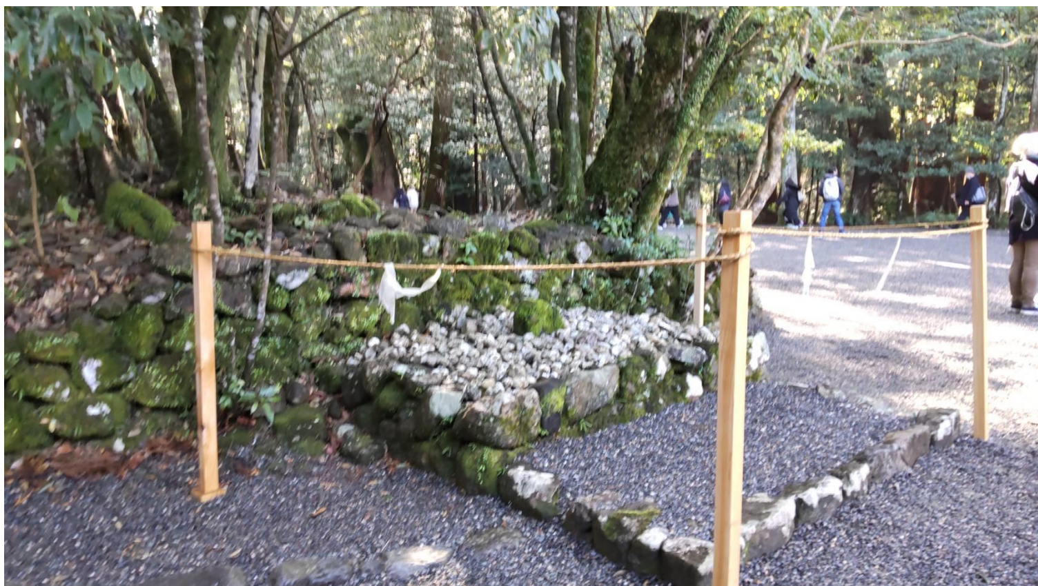
四至神 (みやのめぐりのかみ)