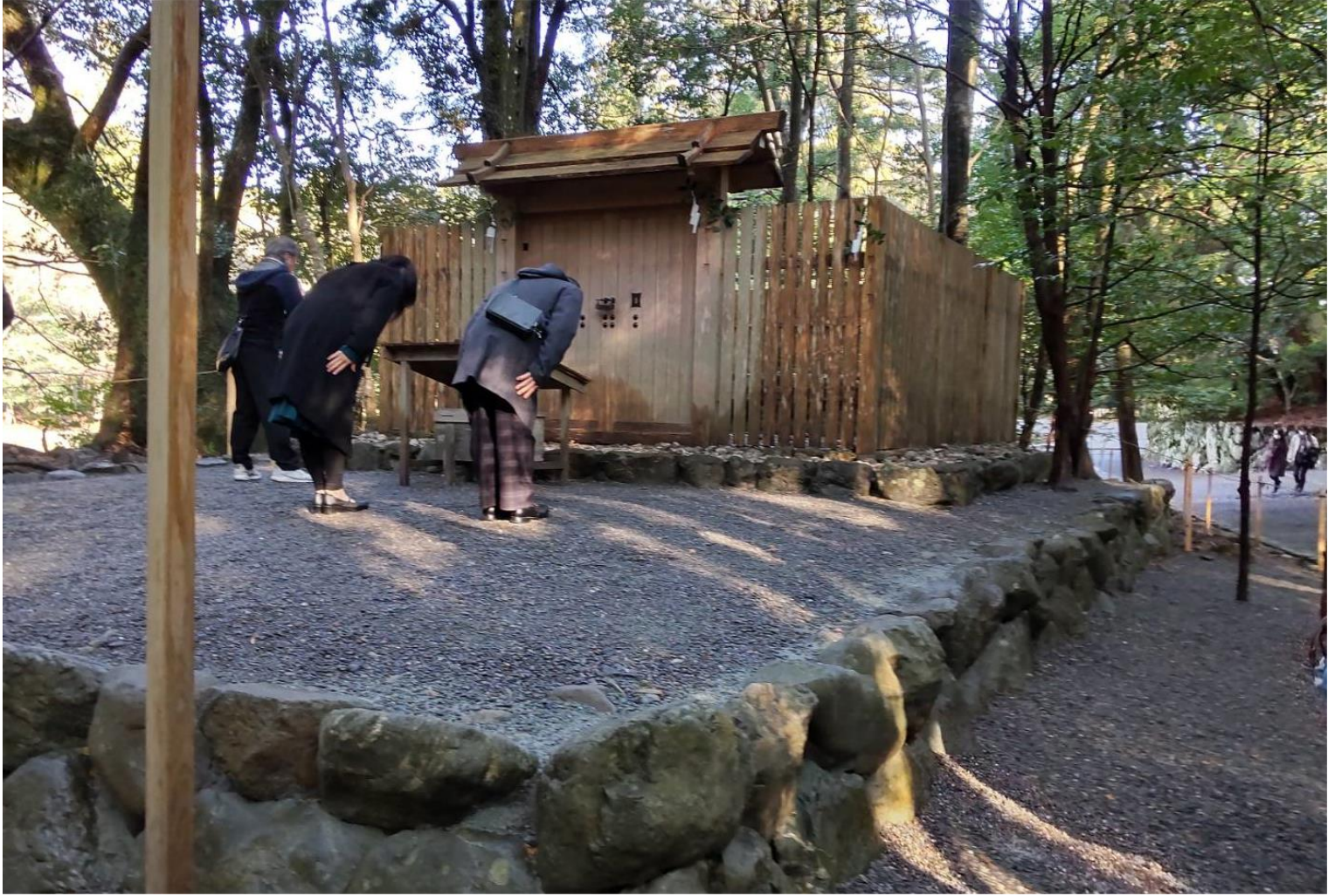
瀧 祭 宮 (たきまつりのみや)