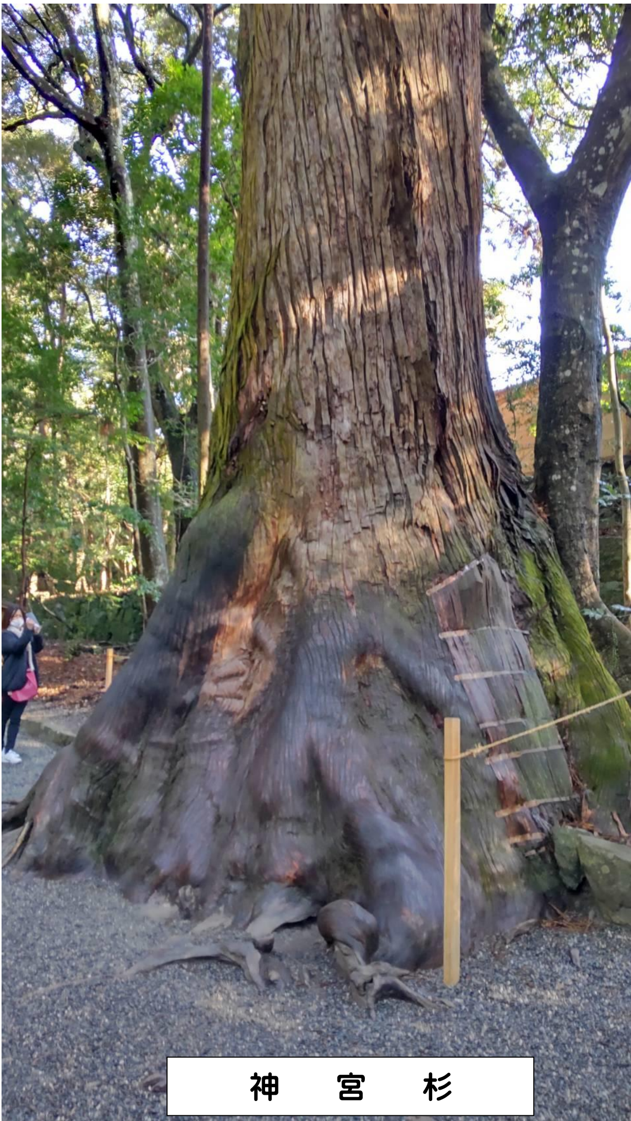
神 宮 杉