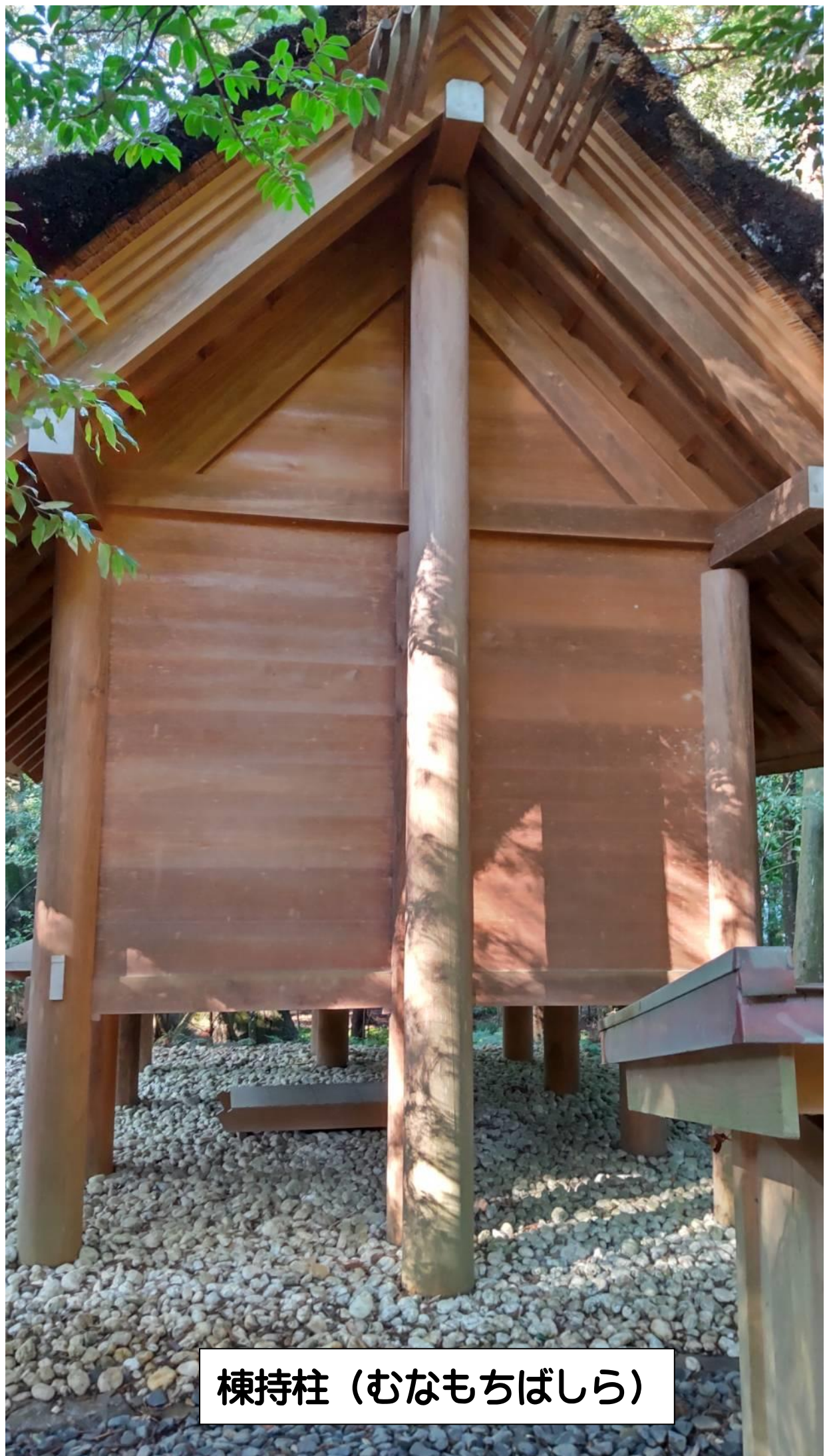
棟持柱（むなもちばしら）