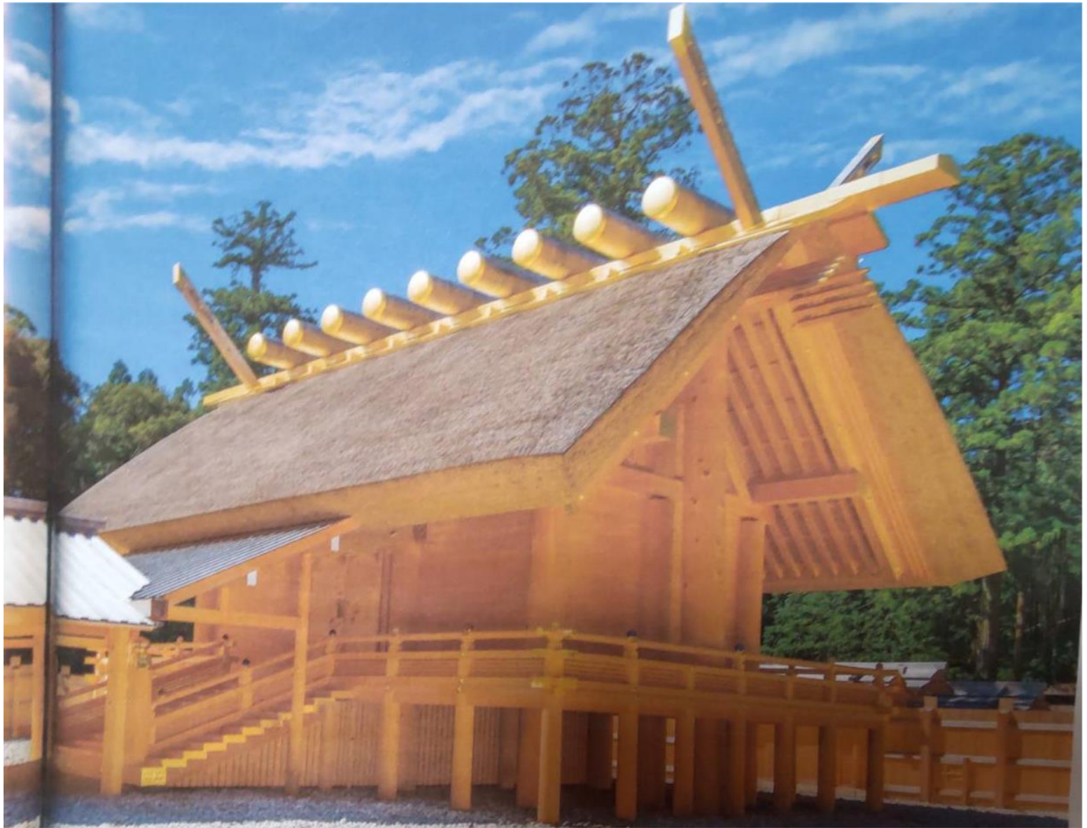
御正殿 (ごしょうでん)