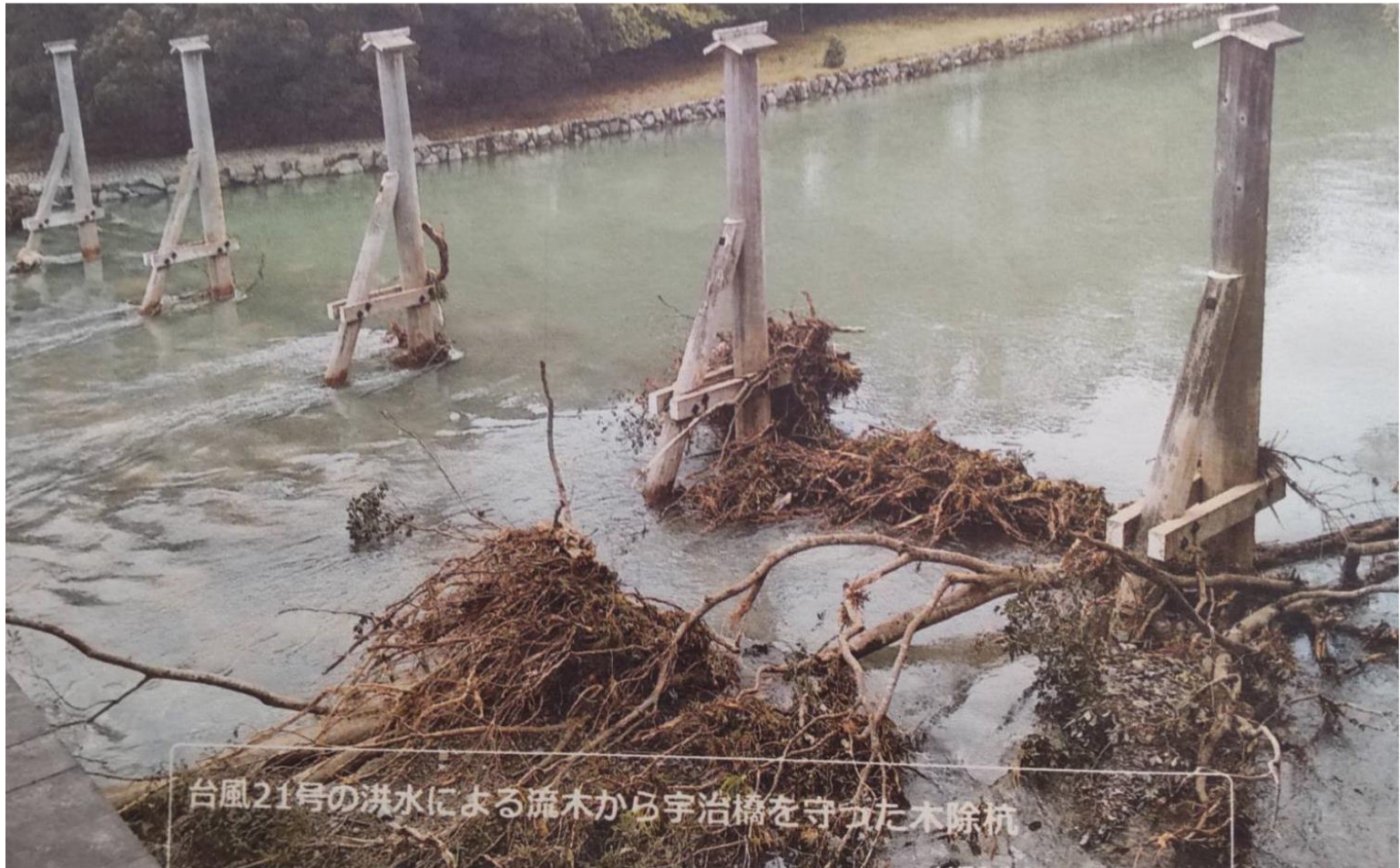
木除杭（きよけぐい）